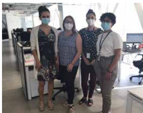
Hospital Digital realiza tutoriales de su plataforma para Médicos de APS y Especialistas (P.06)