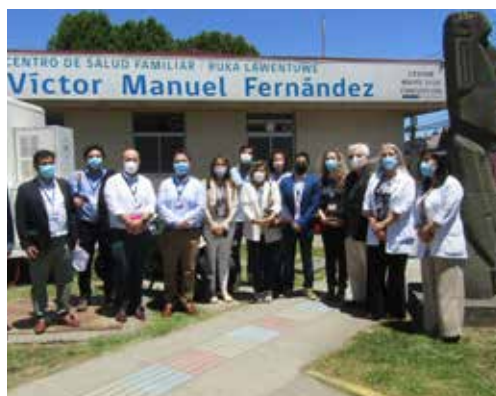
Piloto de Teleortodoncia beneficia a 60 usuarios de Cefsam en la Región del BíoBío (P.05)