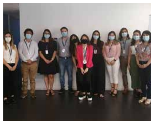
Prensa Local destaca trabajo de Saludablemente tras incendios en Chiloé (P.07)