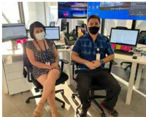
Telecomité Oncológico agiliza evaluaciones de sus pacientes en la macro región extremo sur (P.07)