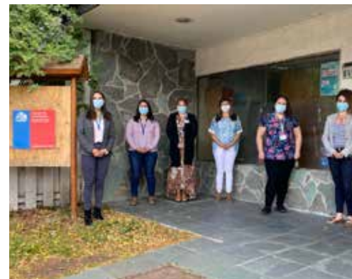
Alianza entre Hospital Digital y PRAIS en Aysén ayudará a reducir listas de espera en diversas especialidades (P.11)