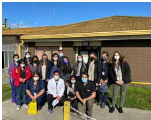
Telecomité Diabetes Mellitus Tipo 1 beneficia a equipos y pacientes de Chiloé (P.04)