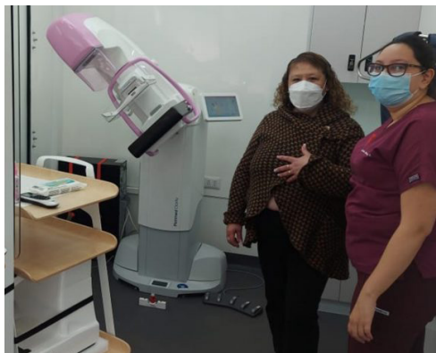
Salud Digital apoya gestión del primer Mamógrafo Móvil del Servicio de Salud Valparaíso – San Antonio. (P.07)