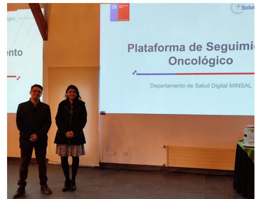
Salud Digital participa en jornada de Gestores Oncológicos del sur del país (P.09)