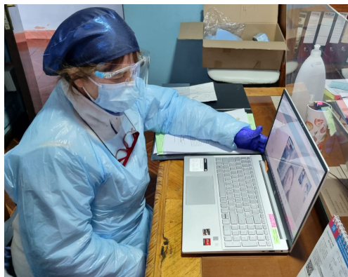
Potencian atenciones de telemedicina para adultos mayores de ELEM en la Quinta Región (P.05)